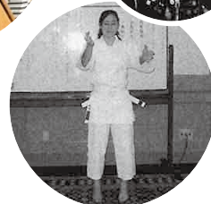
2004年12月21日 長期交換学生送別会にて 空手演技の披露